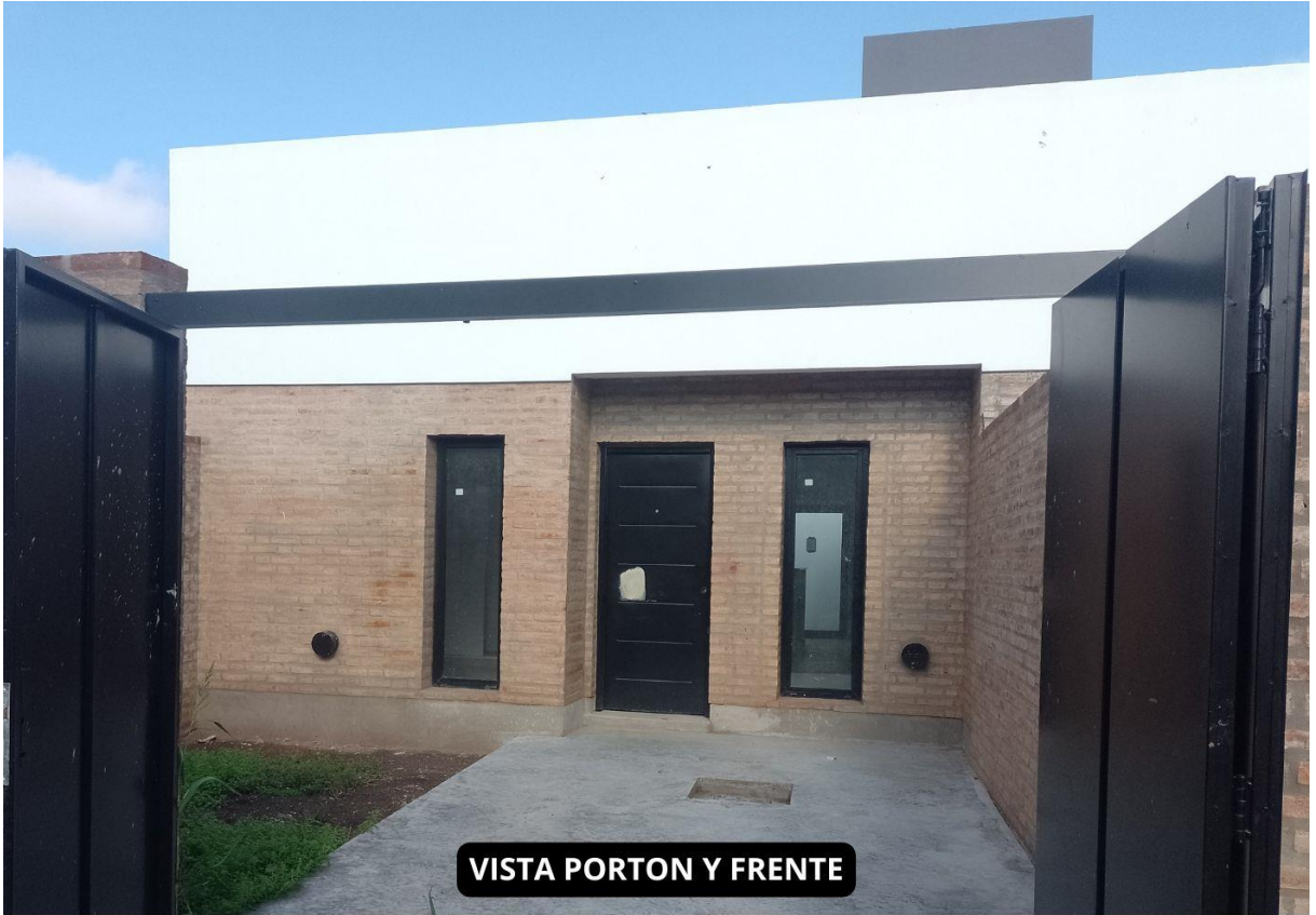
VISTA PORTON Y FRENTE