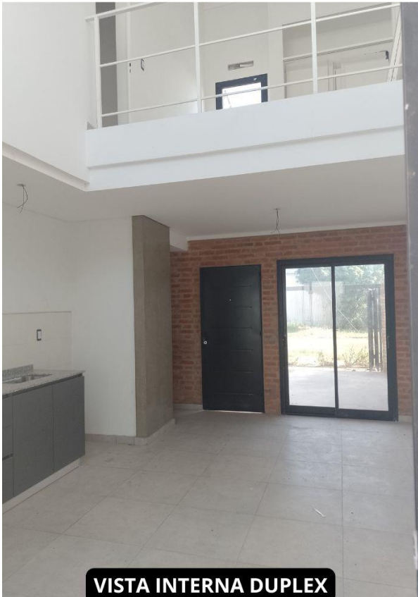
VISTA INTERNA DUPLEX