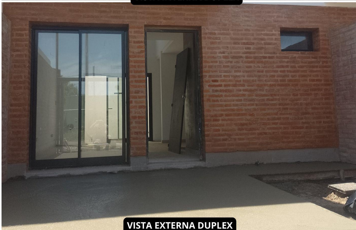
VISTA EXTERNA DUPLEX