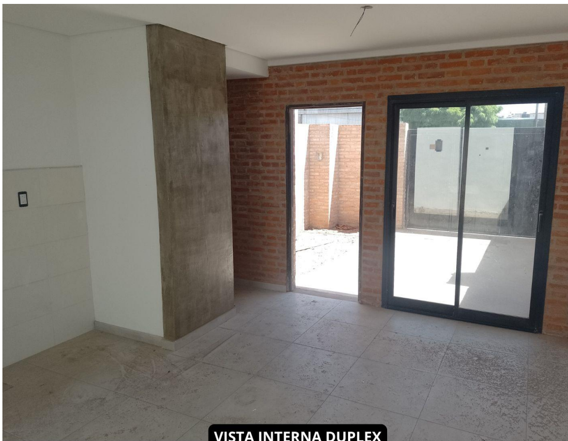
VISTA INTERNA DUPLEX