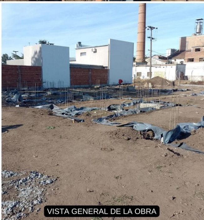
VISTA GENERAL DE LA OBRA