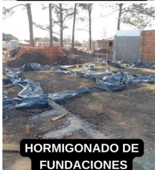
HORMIGONADO DE FUNDACIONES