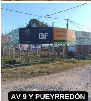
AV 9 Y PUEYREDÓN