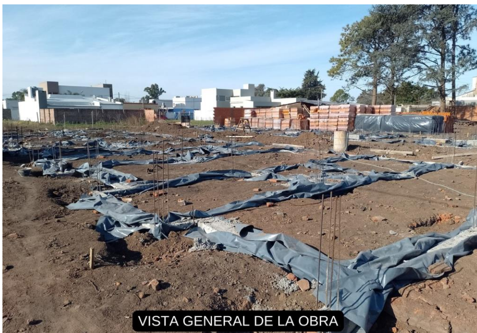
VISTA GENERAL DE LA OBRA

A continuación, adjuntamos algunas fotos que demuestran el grado de avance de las tareas realizadas hasta el momento.