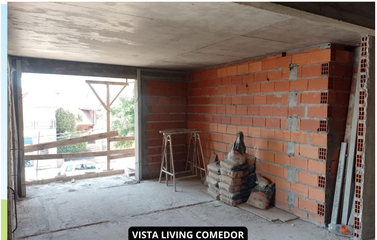
VISTA LIVING COMEDOR