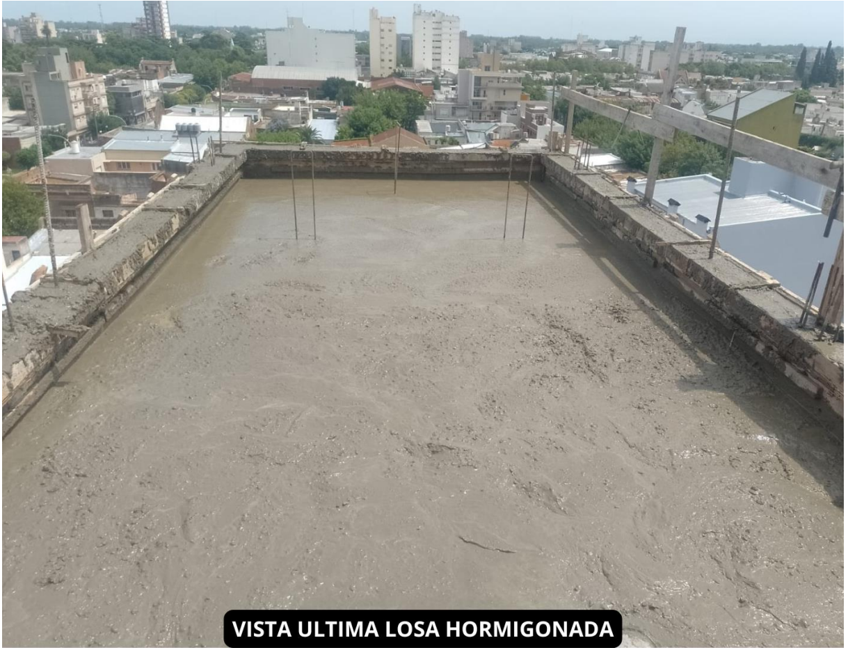
VISTA ULTIMA LOSA HORMIGONADA