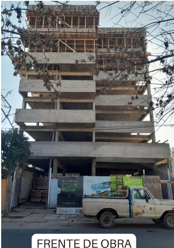
FRENTE DE OBRA