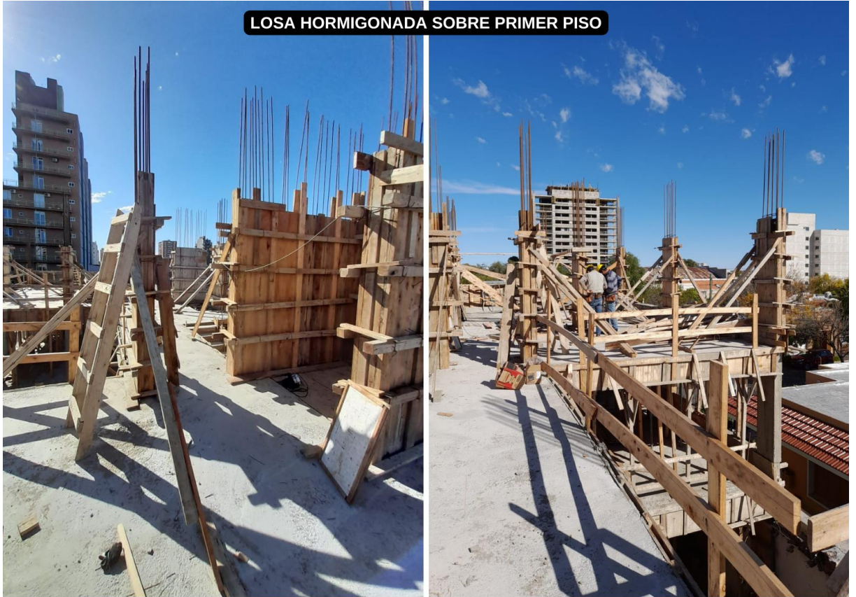
LOSA HORMIGONADA SOBRE PRIMER PISO