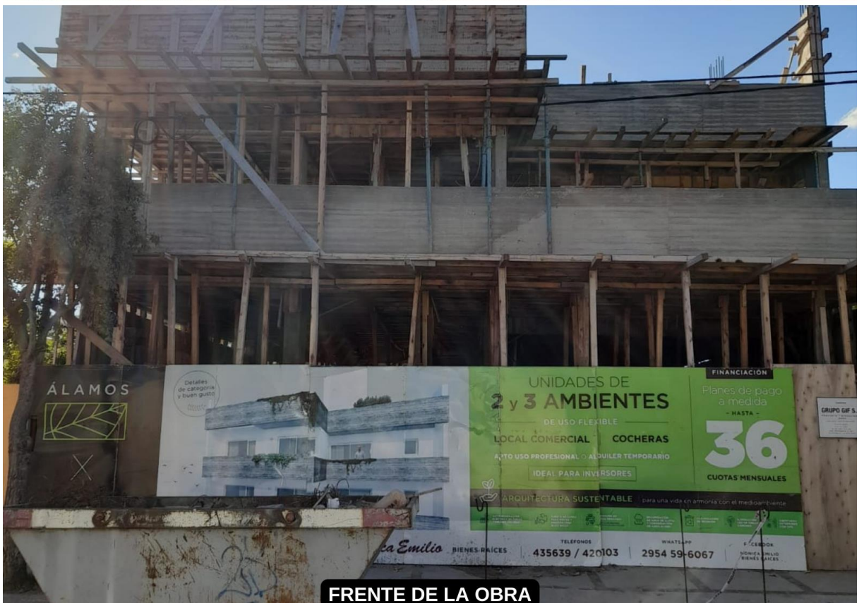
FRENTE DE LA OBRA