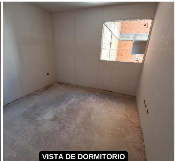
VISTA DE DORMITORIO