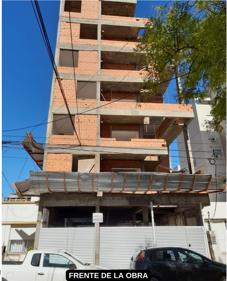
FRENTE DE LA OBRA