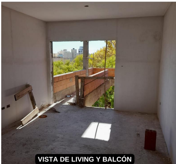
VISTA DE LIVING Y BALCÓN