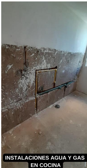
INSTALACIONES AGUA Y GAS EN COCINA