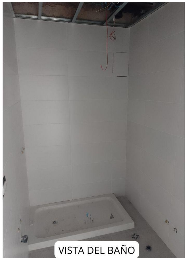
VISTA DEL BAÑO