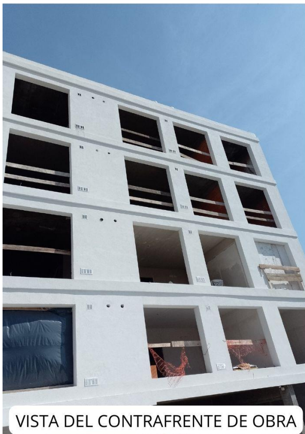
VISTA DEL CONTRAFRENTE DE OBRA