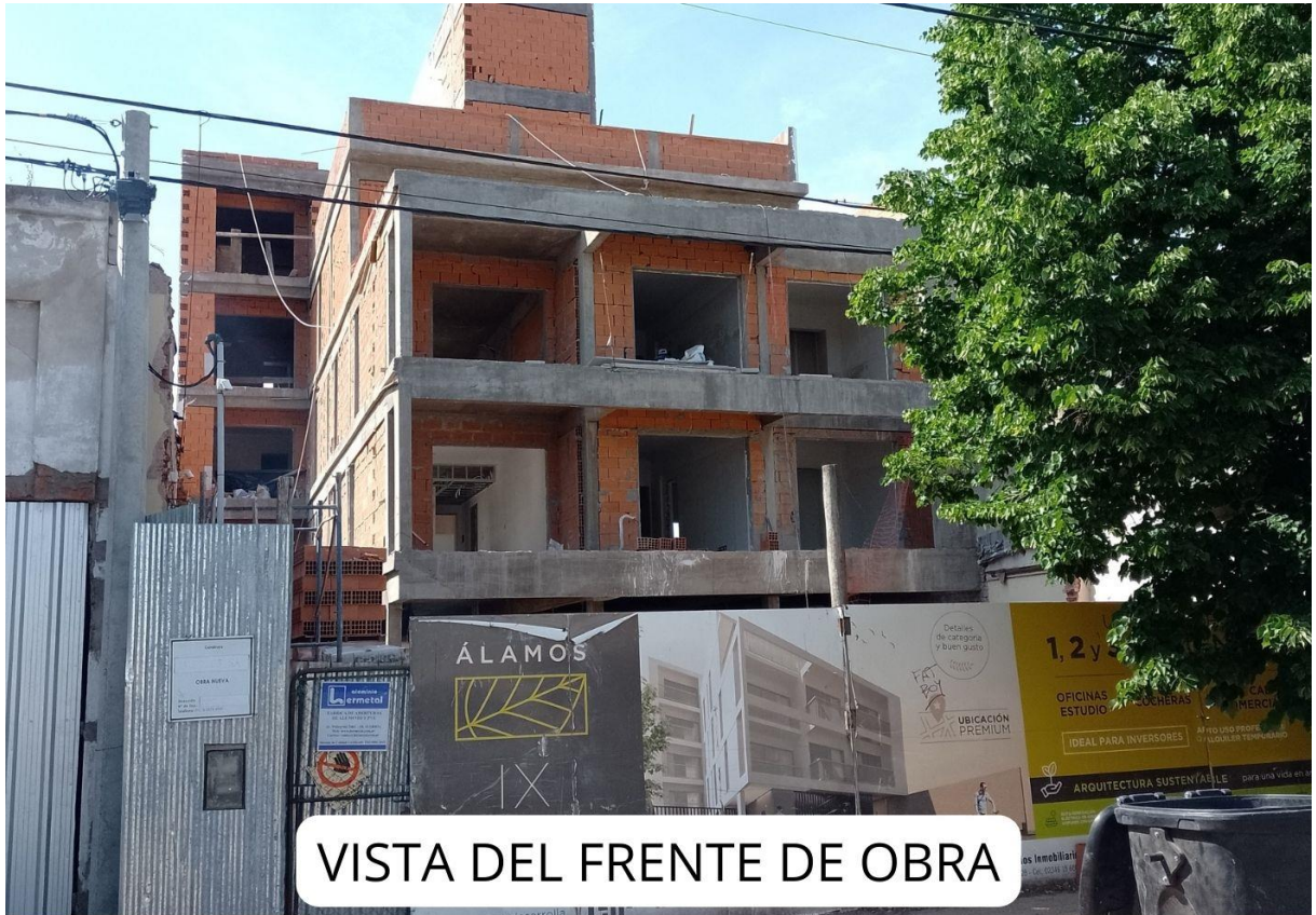
VISTA DEL FRENTE DE OBRA

A continuación, adjuntamos algunas fotos que demuestran el grado de avance de las tareas realizadas hasta el momento.