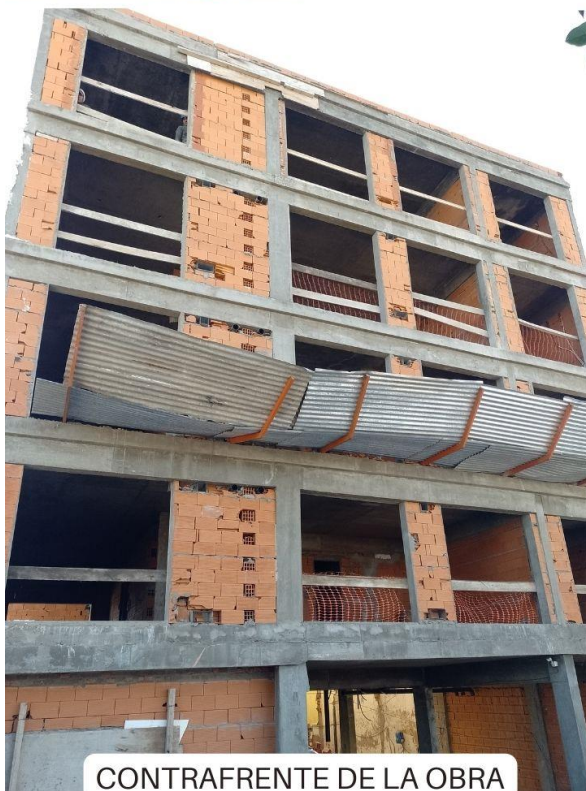
CONTRAFRENTE DE LA OBRA