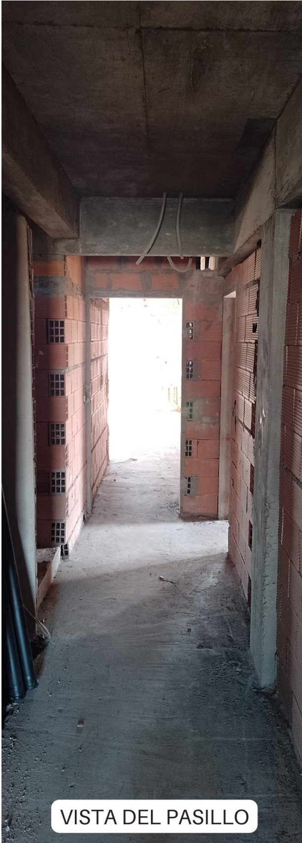
VISTA DEL PASILLO