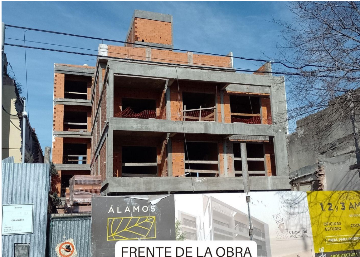
FRENTE DE LA OBRA

A continuación, adjuntamos algunas fotos que demuestran el grado de avance de las tareas realizadas hasta el momento.