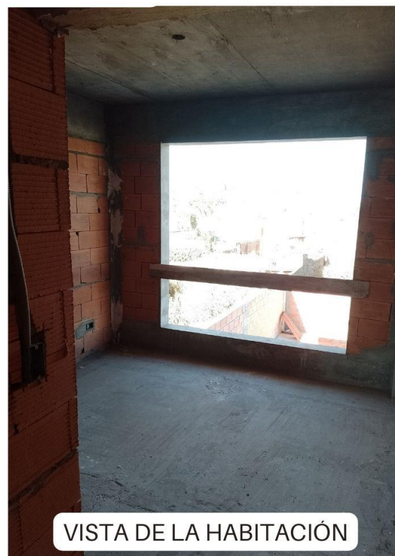
VISTA DE LA HABITACIÓN