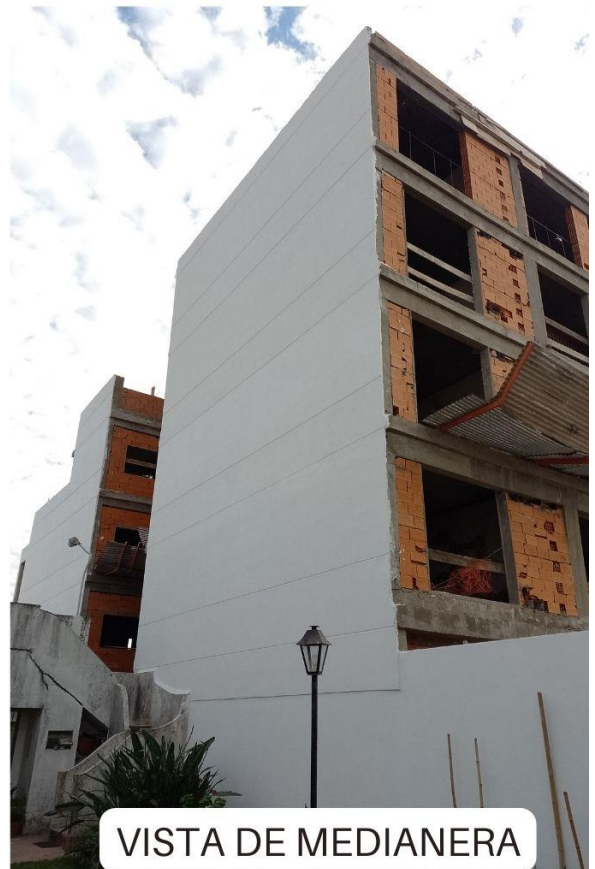
VISTA DE MEDIANERA