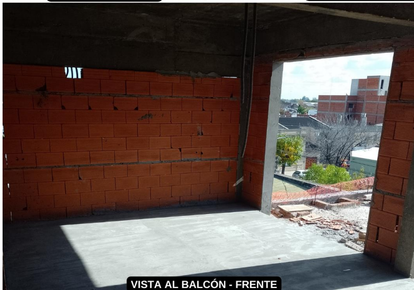
VISTA AL BALCÓN - FRENTE