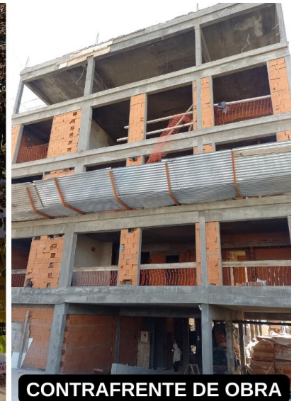
CONTRAFRENTE DE OBRA