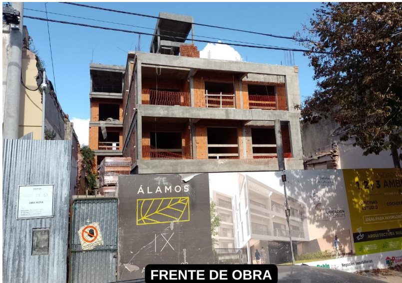
FRENTE DE OBRA