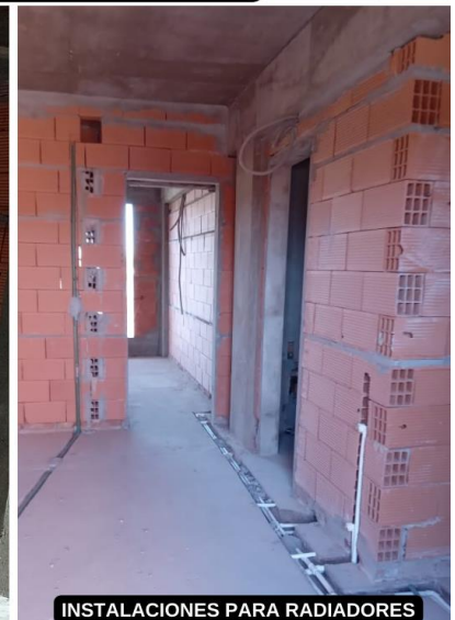
INSTALACIONES PARA RADIADORES