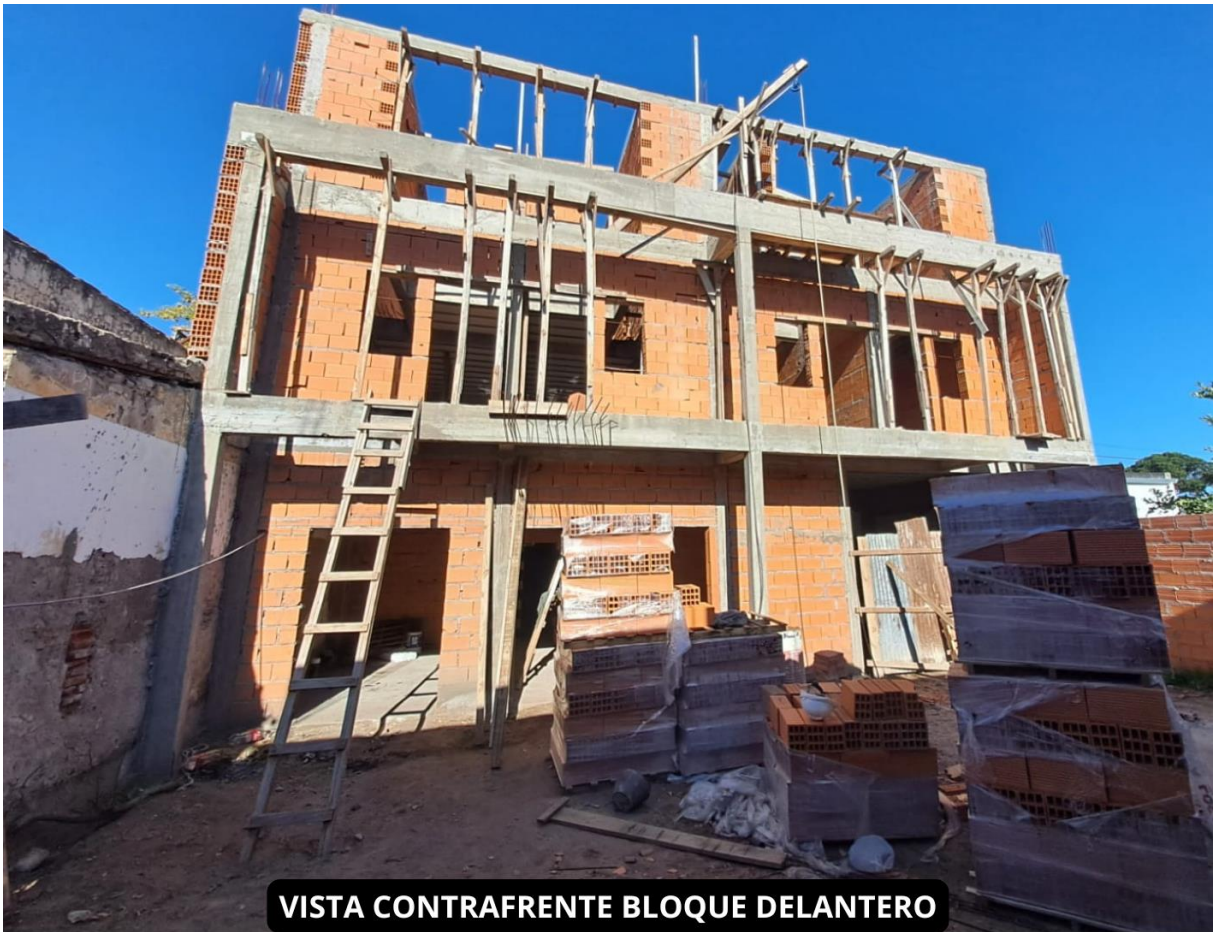
VISTA CONTRAFRENTE BLOQUE DELANTERO