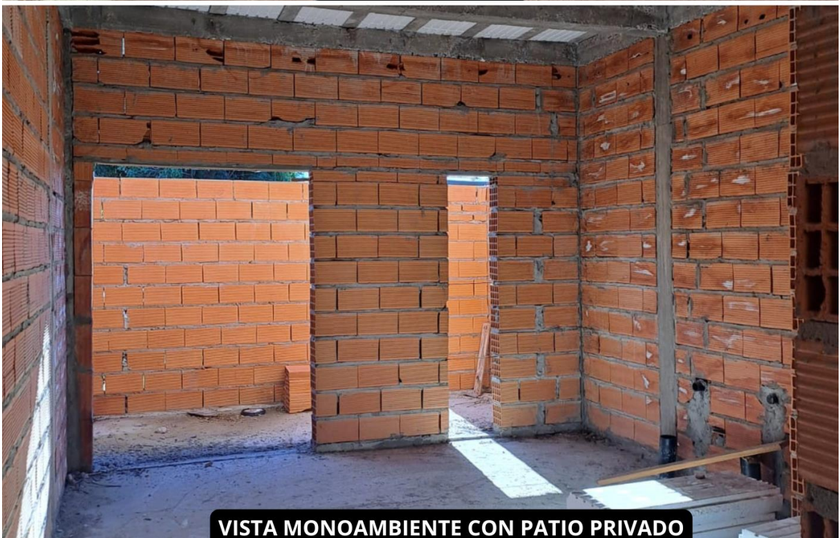
VISTA MONOAMBIENTE CON PATIO PRIVADO