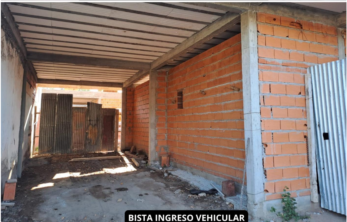
BISTA INGRESO VEHICULAR