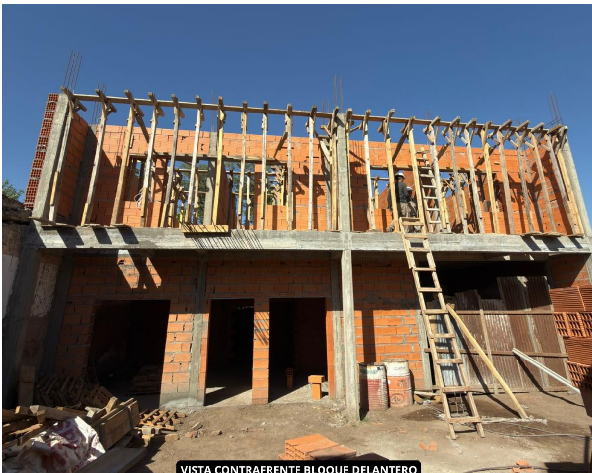
VISTA CONTRAFRENTE BLOQUE DELANTERO