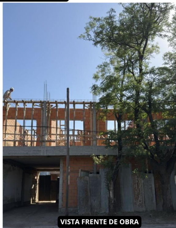
VISTA FRENTE DE OBRA