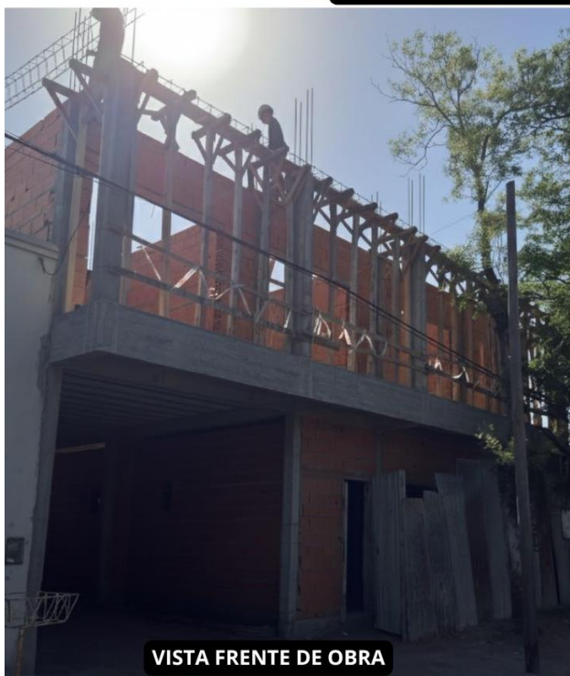
VISTA FRENTE DE OBRA