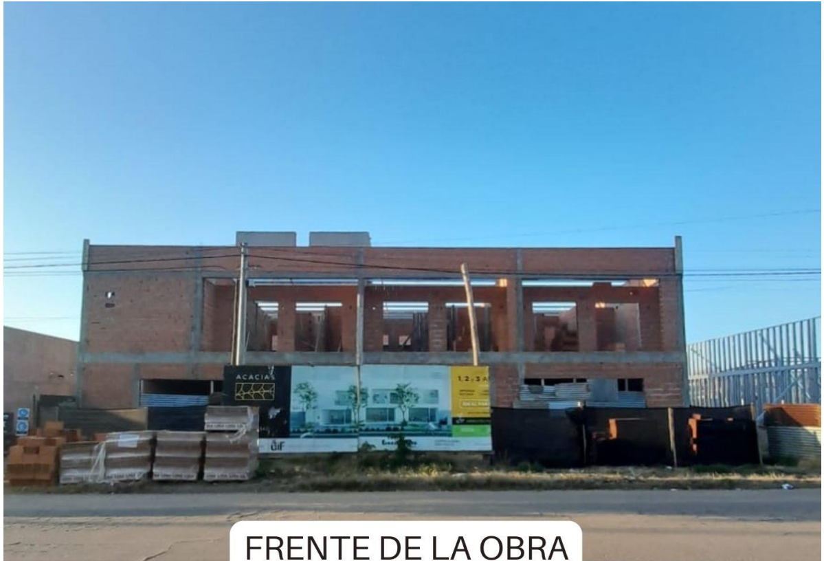
FRENTE DE LA OBRA

A continuación, adjuntamos algunas fotos que demuestran el avance de las tareas realizadas hasta el momento.