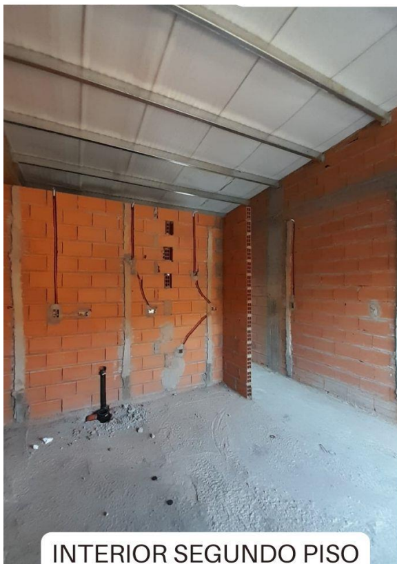
INTERIOR SEGUNDO PISO