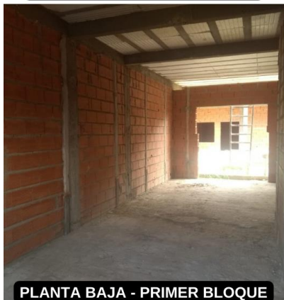
PLANTA BAJA - PRIMER BLOQUE