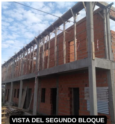
VISTA DEL SEGUNDO BLOQUE