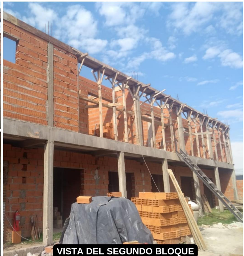
VISTA DEL SEGUNDO BLOQUE