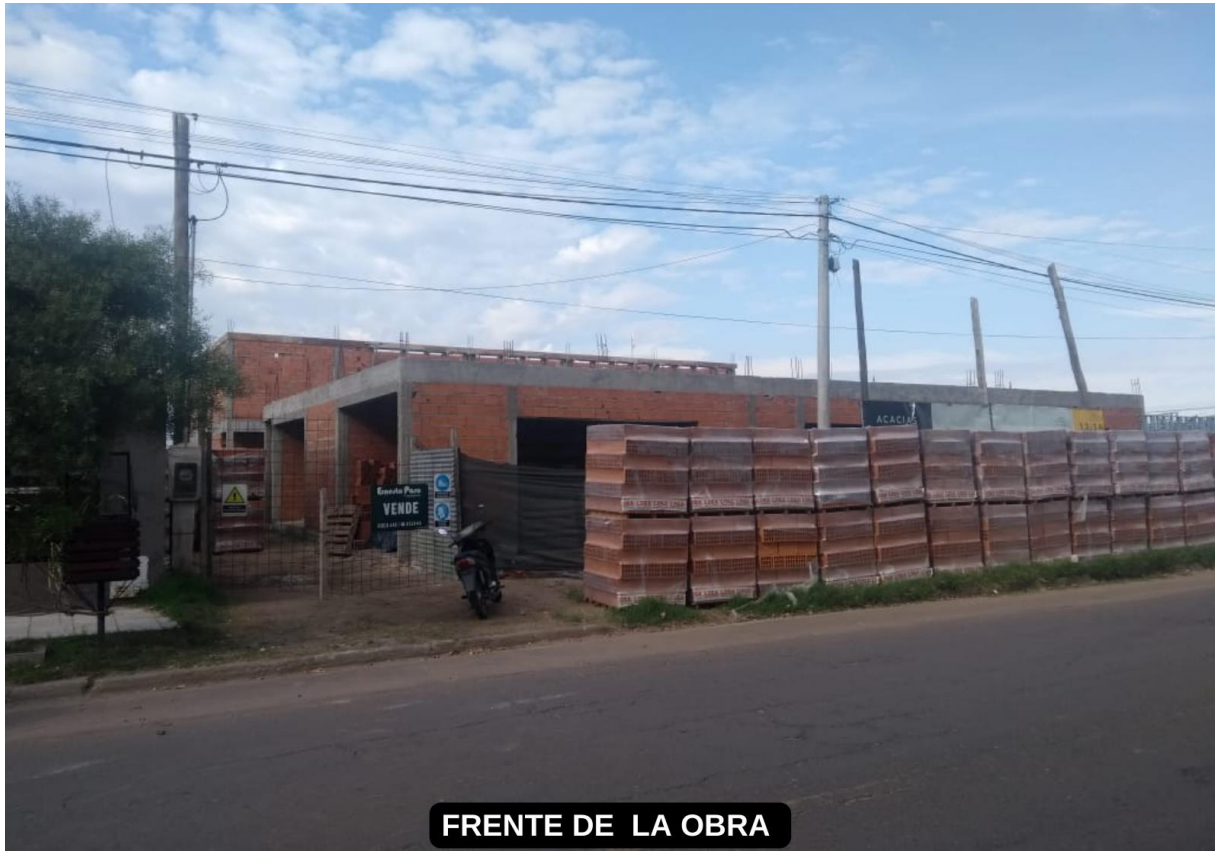
FRENTE DE LA OBRA