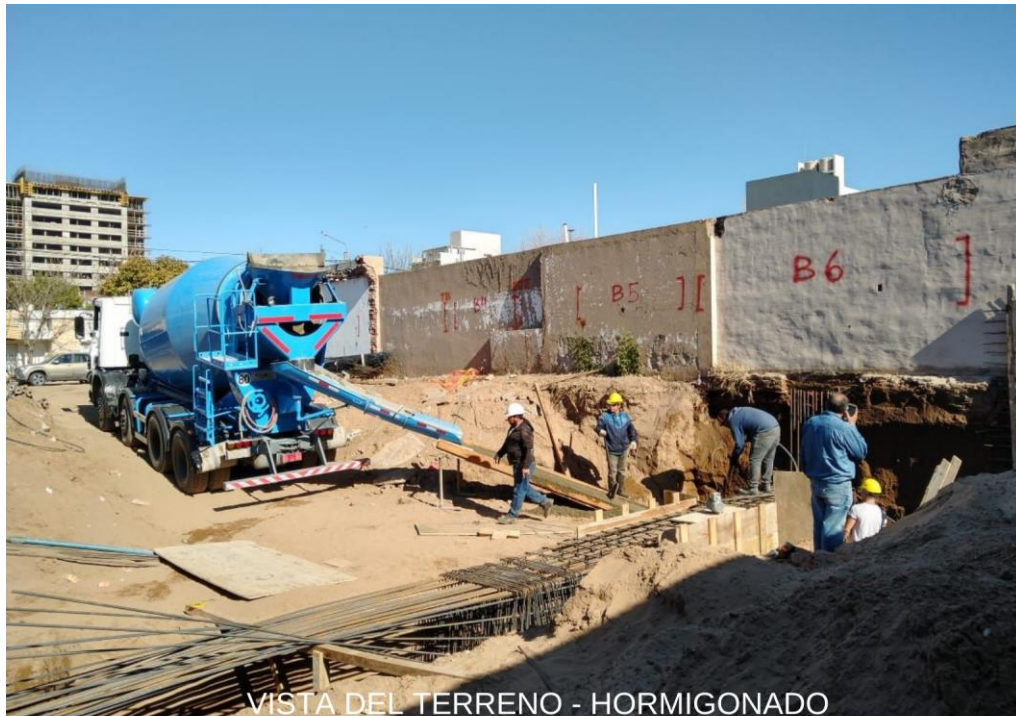
VISTA DEL TERRENO - HORMIGONADO