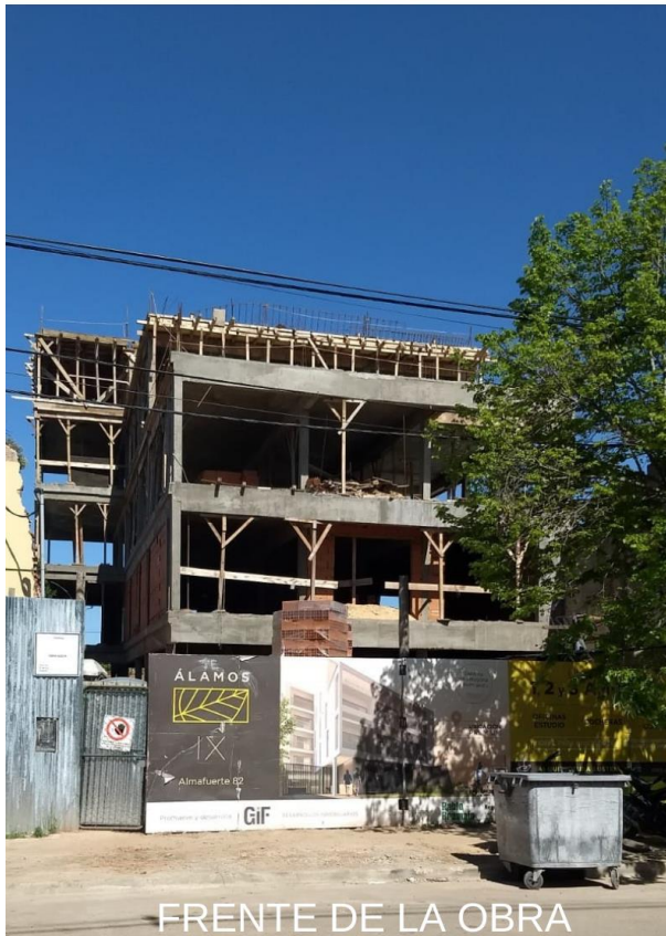
FRENTE DE LA OBRA