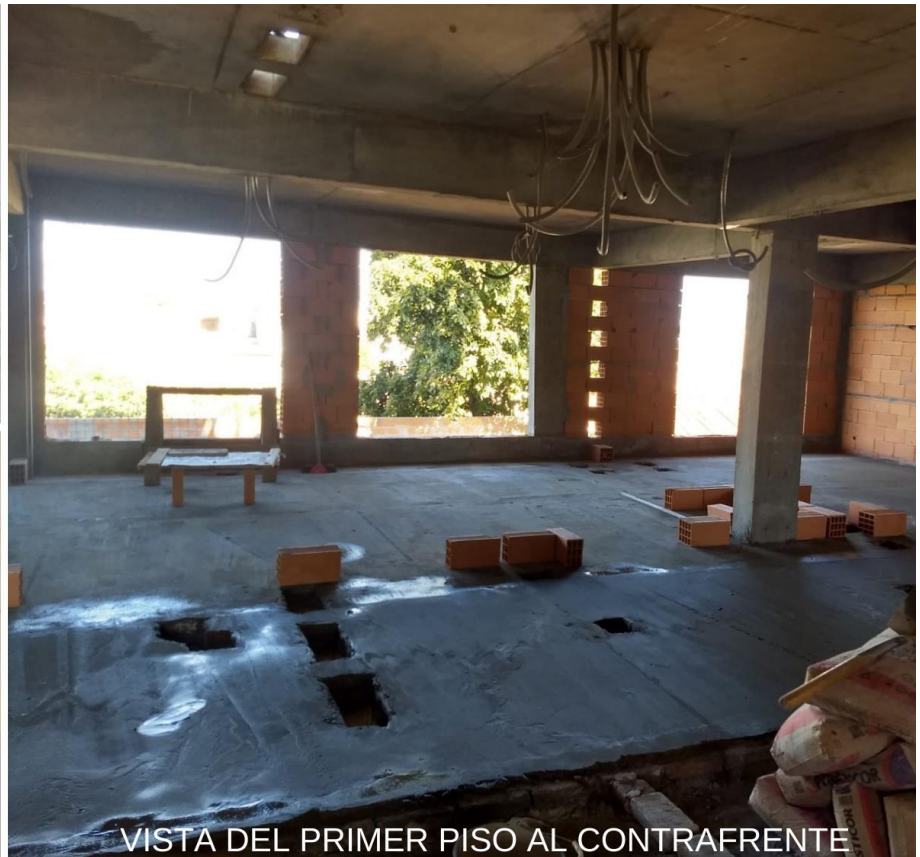
VISTA DEL PRIMER PISO AL CONTRAFRENTE