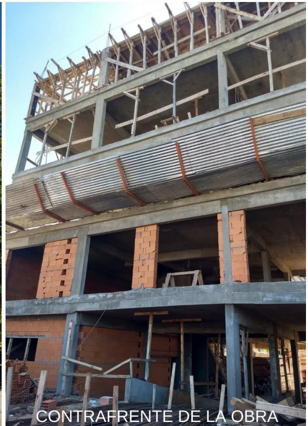
CONTRAFRENTE DE LA OBRA