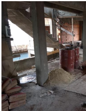
ESCALERA 1° PISO